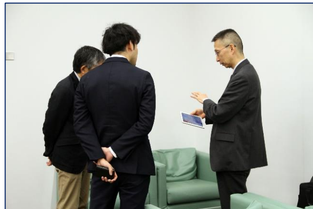
iPadによるデモの様子