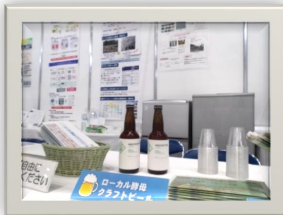
出展ブースの様子