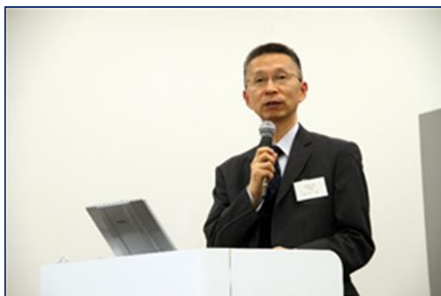
花木教授による発表の様子