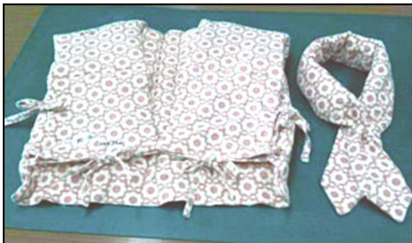
産学官金連携により開発された「寝ごころちゃん」